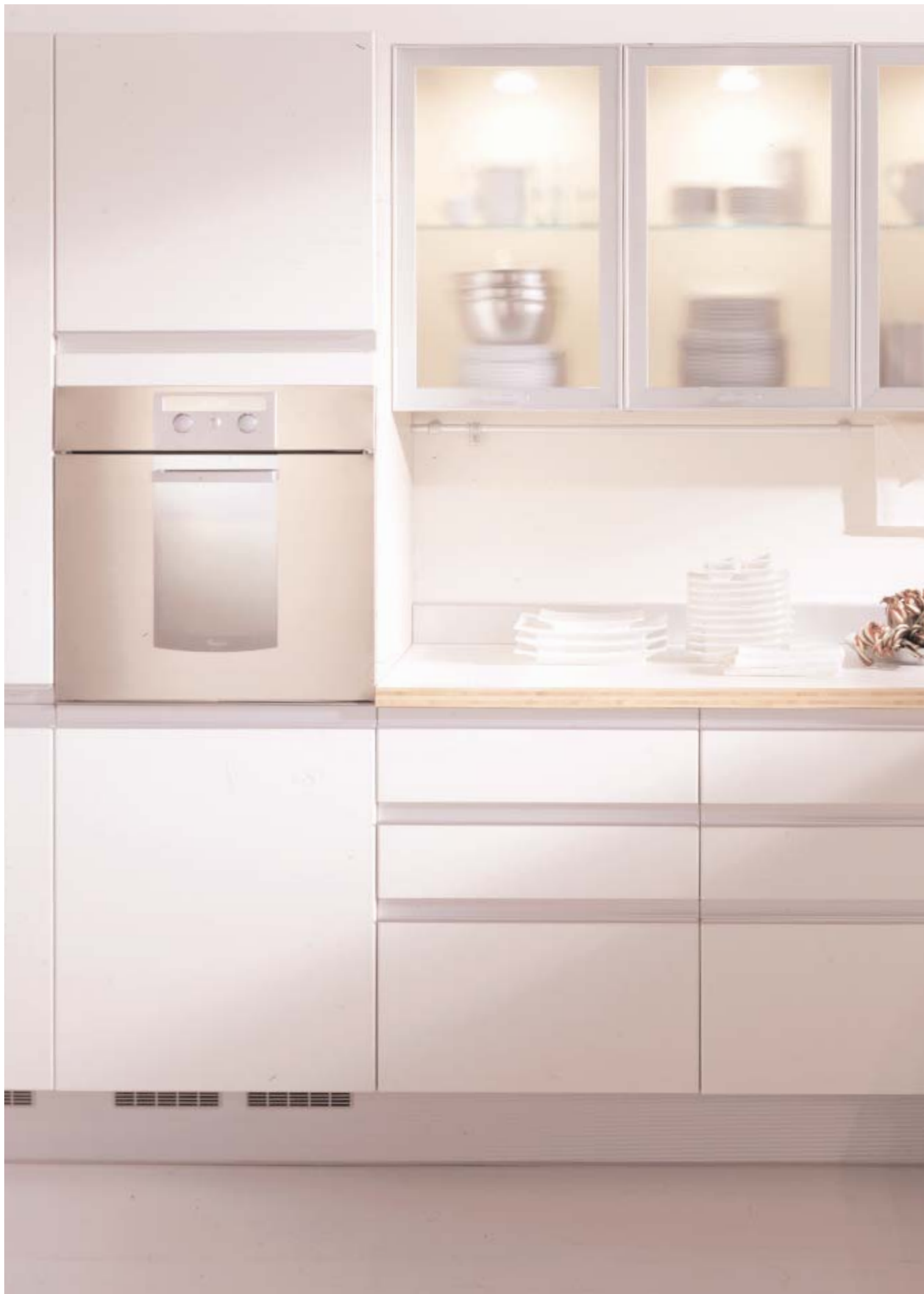
Immagine di ambiente tecnologico e funzionale / The image of a technologically functional environment / Image d'une ambiance technologique et fonctionnelle / Imagen de ambiente tecnológico y funcional.