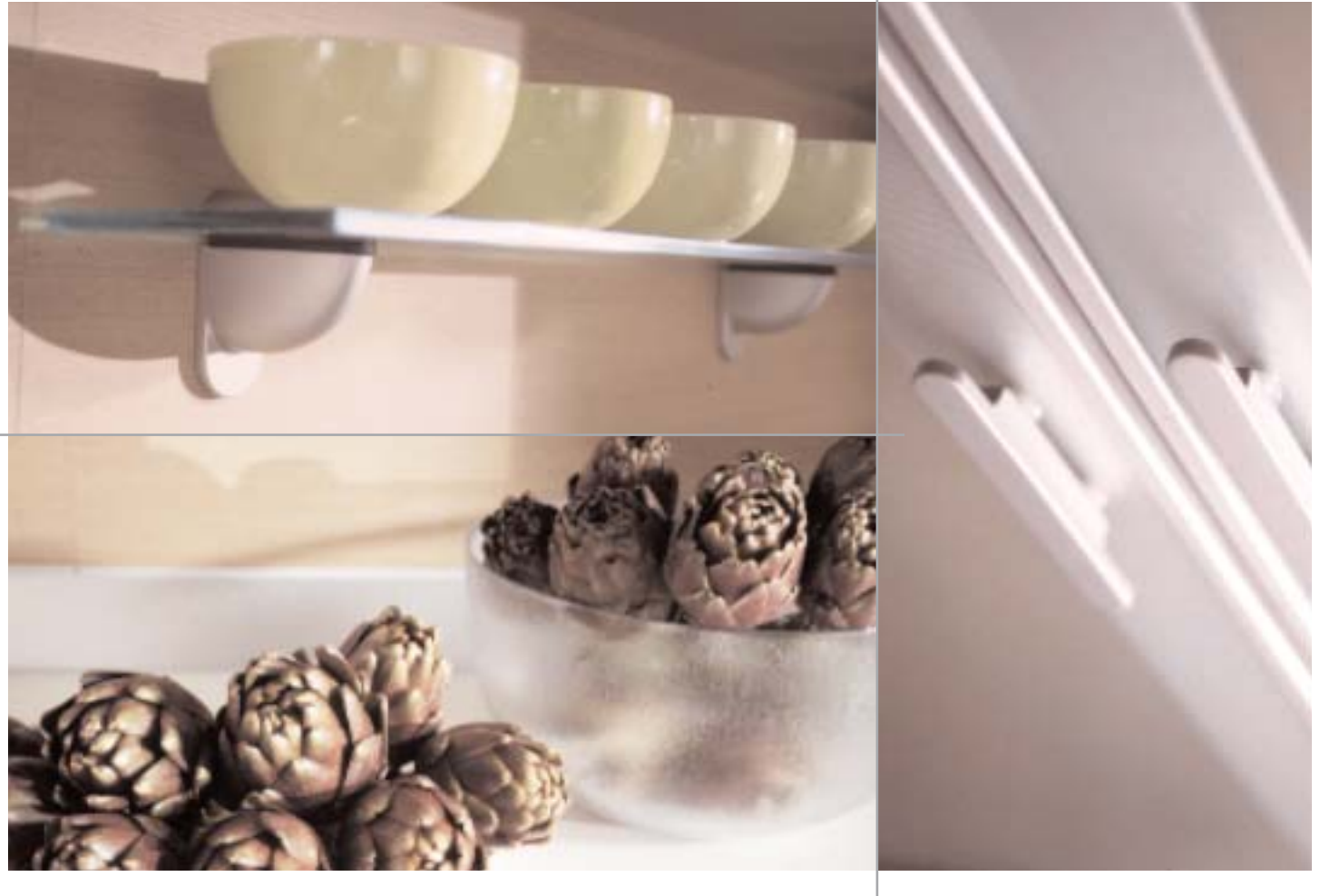
Particolari della mensola sottopensile a vetro e della maniglia in alluminio per gli elementi a vetro / A close up view of the glass shelf under the cabinet and the aluminium handle for the glass-fronted elements / Détails d'une étagère en verre sous l'élément haut et de la poignée en aluminium pour les éléments vitrés / Detalles de la repisa inferior de cristal y del tirador de aluminio de los módulos de cristal.