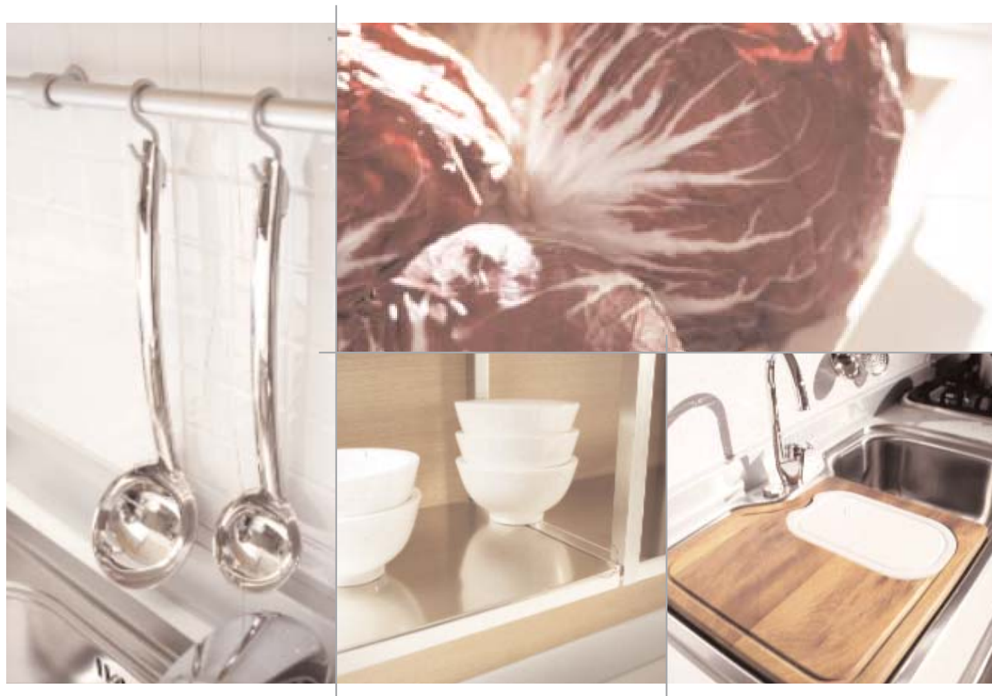
Dettagli dello scolapiatti con anta vetro a telaio, della nuova struttura con parapolvere e dell'elemento a serrandina con finitura in alluminio / Close up of the dish drainer with framed glass door, the new structure with dust proof strip and the aluminium finish unit with shutter closure / Détails de l'égouttoir avec porte vitrée à châssis, de la nouvelle structure anti-poussières et de l'élément à rideau avec finition aluminium / Detalles del escurridor con puertas de cristal, de la nueva estructura con guardapolvo y del módulo con persiana y acabado de aluminio.