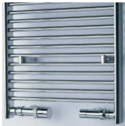
Valvola e detentore reversi