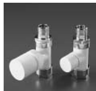
Valvola e detentore diritti