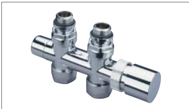
Valvola 50 mm diritta versione cromata (reversibile)