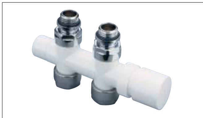
Valvola 50 mm diritta versione bianca (reversibile)