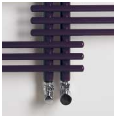
Valvola e detentore a squadra