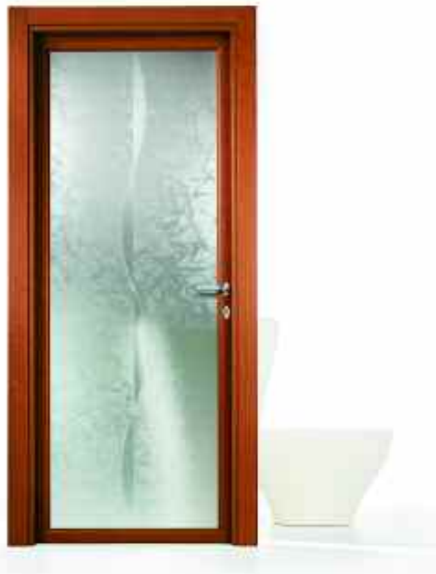
■ VETRO INCANTO. ■ SOLUZIONE BT210/ 0.