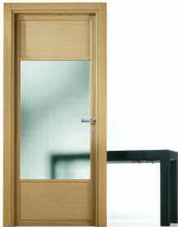
■ VETRO PAVÉ. ■ SOLUZIONE BT210/ 1-4.