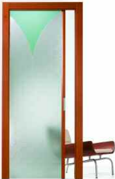
■ VETRO STELO. ■ SOLUZIONE SI210/ V.