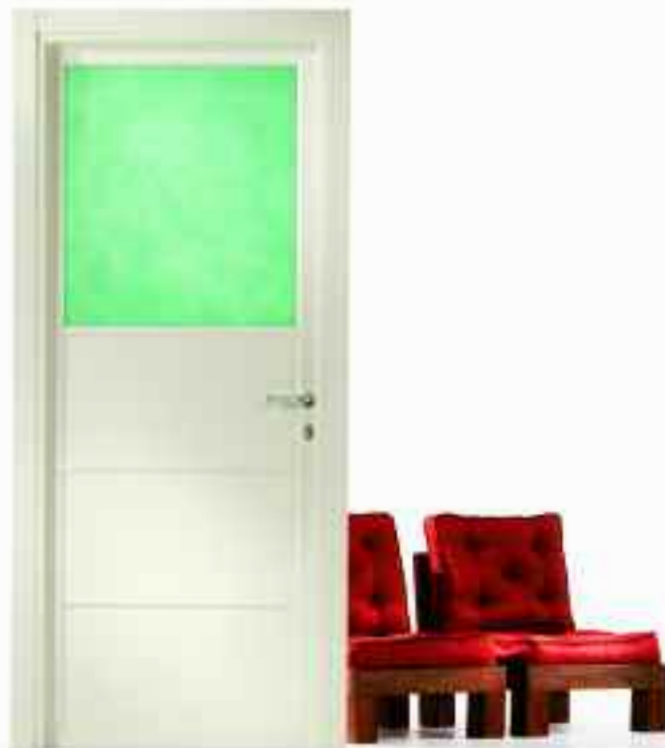
■ VETRO FOREST. ■ SOLUZIONE BT210/ 1-2-3.