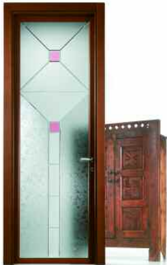
■ VETRO METRICA. ■ SOLUZIONE BT250/ 0.