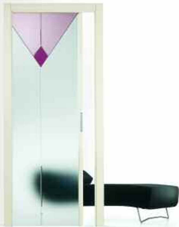
■ VETRO PUNTO. ■ SOLUZIONE SI210/ V.