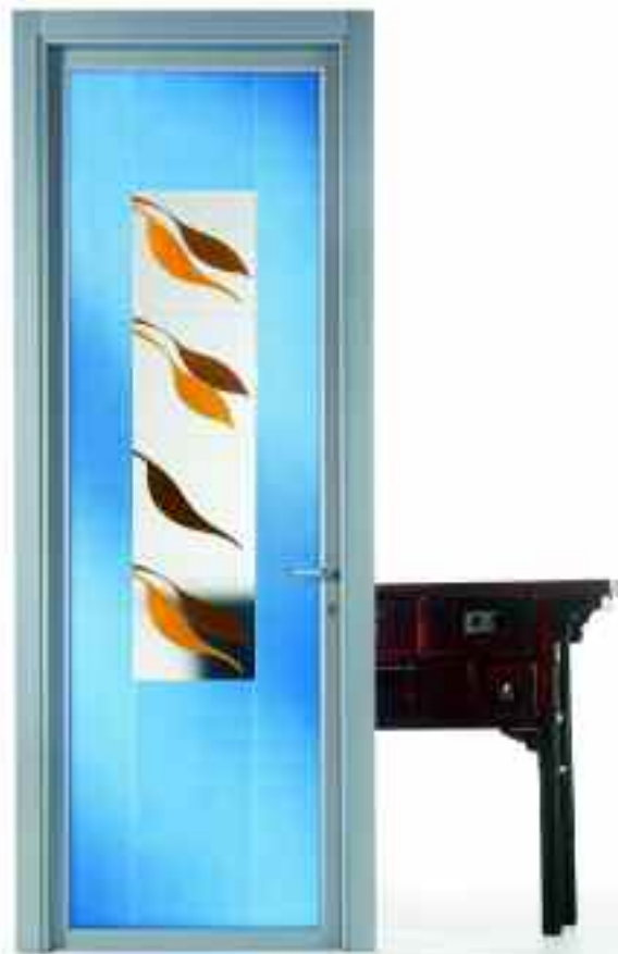
■ VETRO DANZA. ■ SOLUZIONE BT250/ 0.