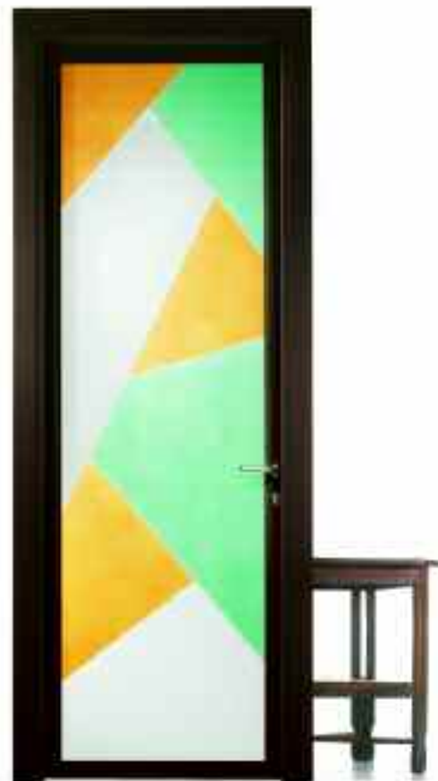
■ VETRO ESTIVA. ■ SOLUZIONE BT250/ 0.