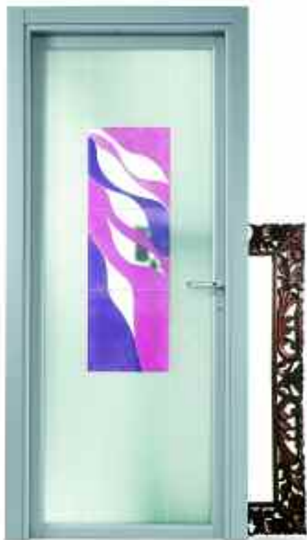
■ VETRO ALBA. ■ SOLUZIONE BT210/ 0.