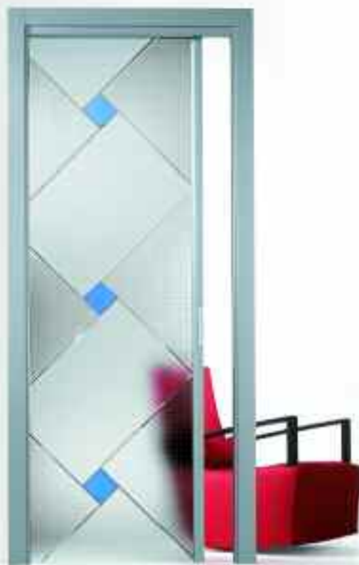
■ VETRO GIRANDOLA. ■ SOLUZIONE SI210/ V.