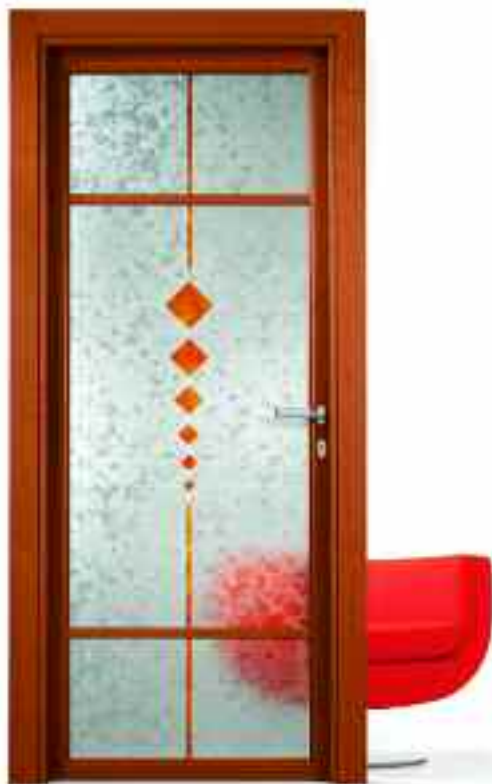
■ VETRO INTAGLIO. ■ SOLUZIONE BT210/ 1-4.