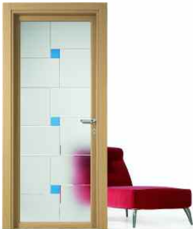
■ VETRO QUADRA. ■ SOLUZIONE BT210/ 0.