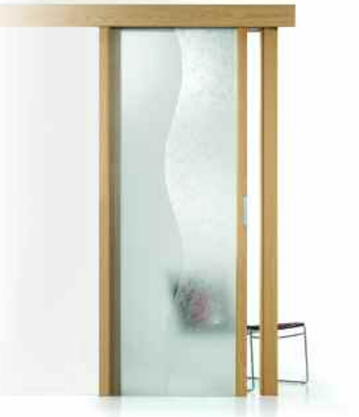
■ VETRO BREZZA. ■ SOLUZIONE SE210/ V.