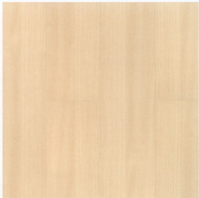
faggio due light 9243