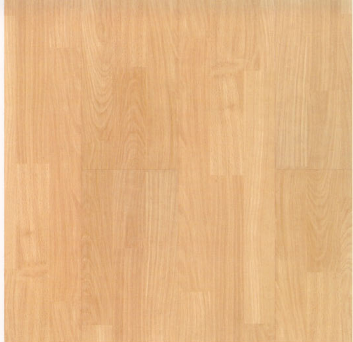
faggio light 9237