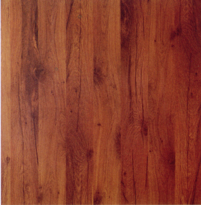
noce naturale 9263