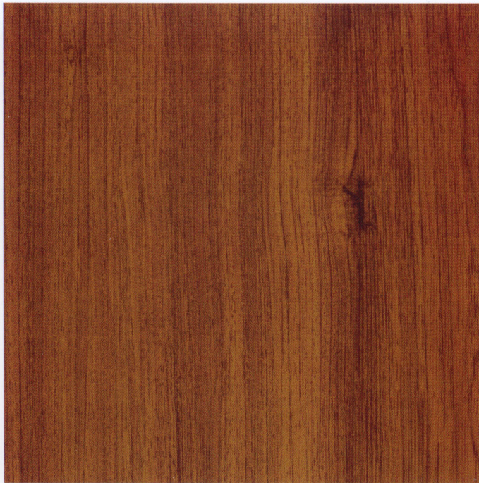
giava teck 9645