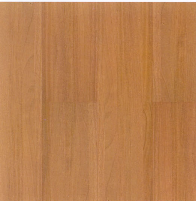
noce light 9238