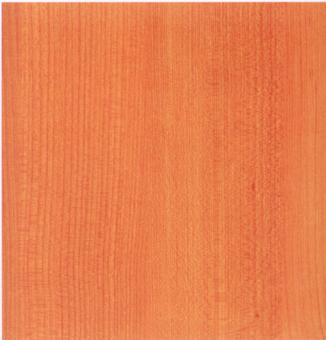
ciliegio marasca 9672