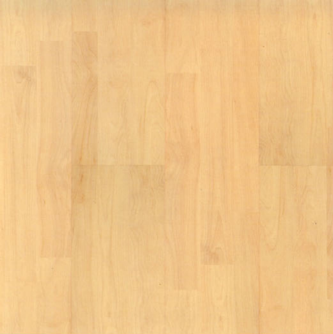
betulla light 9236