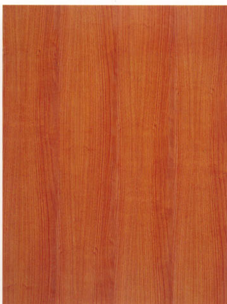
1643 ciliegio america tavolato