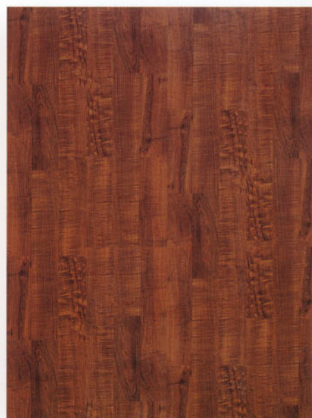
9581 noce italiano dogato