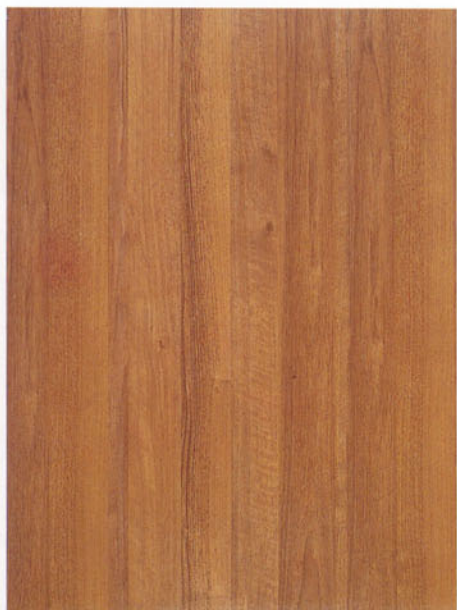
1636 noce italiano tavolato