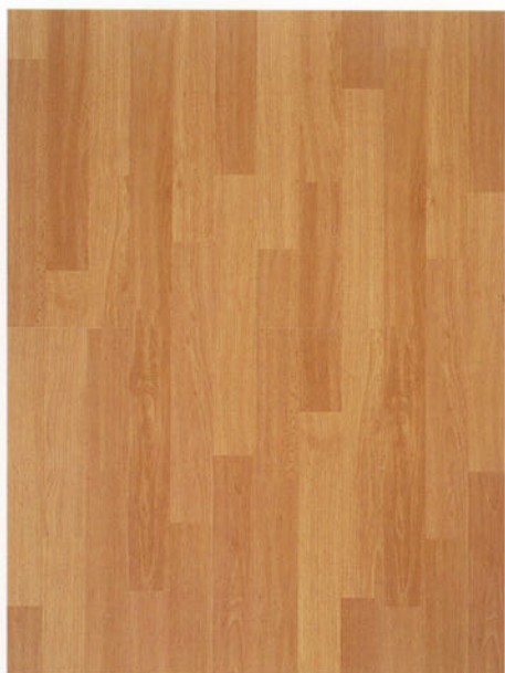
9335 faggio dogato