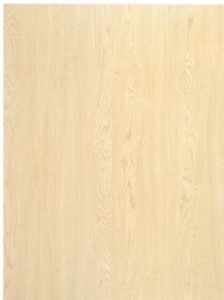
9371 frassino floor tavolato