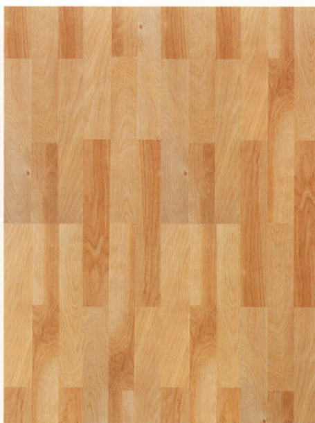
9582 betulla kalevala dogata