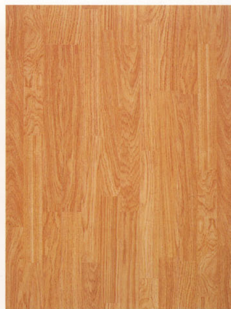
9316 rovere reale dogato