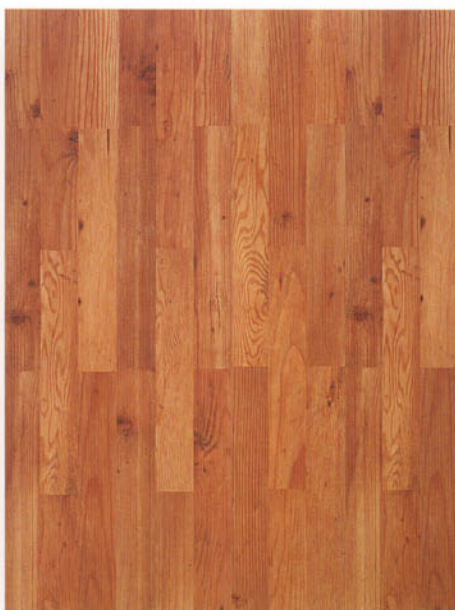
9584 pino old west dogato