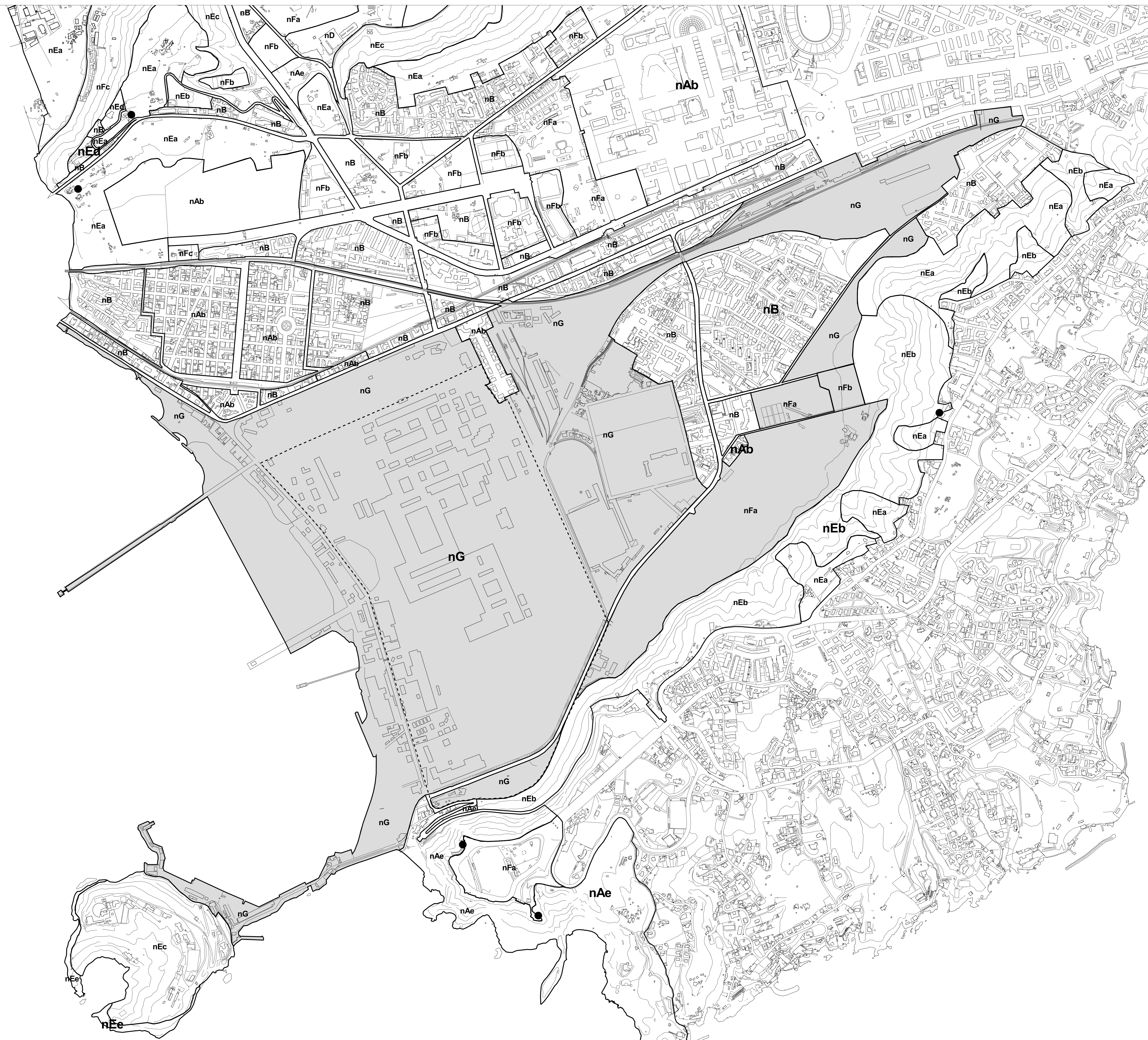
tavola 1 scala 1:5.000